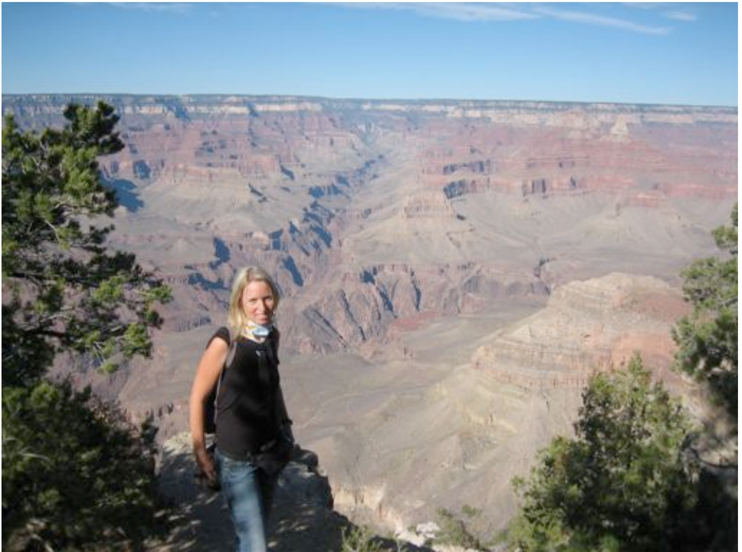
Grand Canyon Schlucht