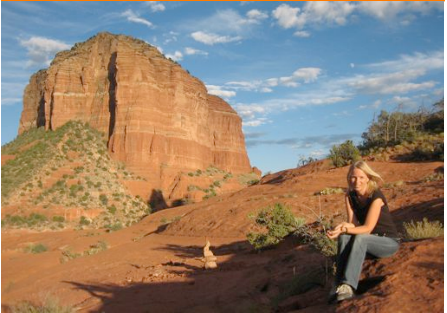
Red Rock bei Sedona