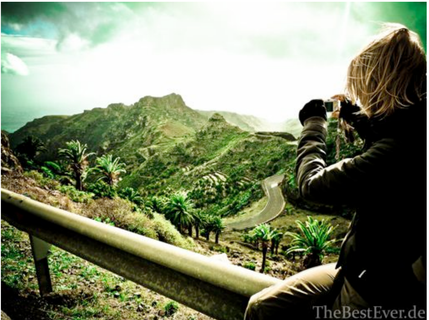
Wanderung auf La Gomera

Jahr an drei unterschiedlichen Messestandorten stattfinden, Deiner Einschät-