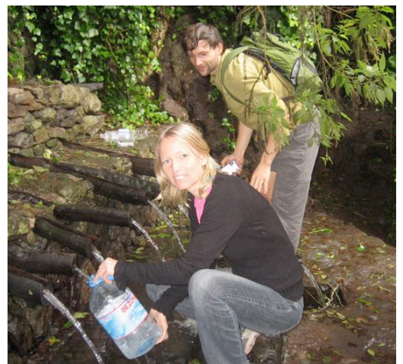
Frisches Quellwasser auf La Gomera

In Bezug auf die Natur kommt ein Vitalköstler Down Under sicher ebenfalls voll auf seine Kosten. Die Aussies lieben es, ihren Abenteuergeist in wildromantischen Nationalparks auszuleben. Diese bieten z.B. 80 Meter hohe Eukalyptusbäume, die jeder frei erklimmen kann. Auch die vielen Canyons bieten neben einer reichen Tier- und Pflanzenwelt, viele kristallklare Naturpools sowie abenteuerliche Trekkingpfade.