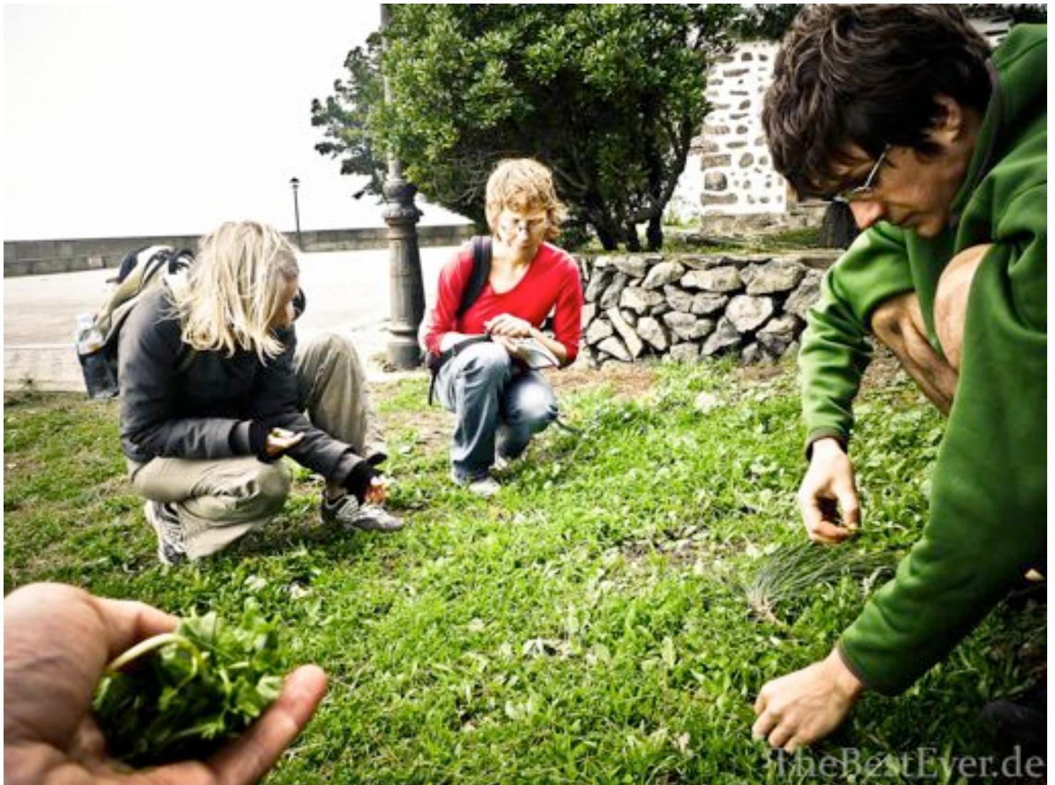
Wildkräutersammeln auf La Gomera

Leben. Negative Gefühle wie Neid, Missgunst, Wettbewerbsdenken etc. fallen immer mehr ab. Liebende zuwendende Energien verstärken sich. Für mich ist dies das größte Geschenk der Vitalkost. Bei Wildkräutern spürt man das am stärksten. Die schenken dem