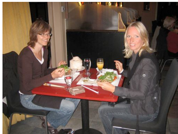
Im Vitalkost-Restaurant in Los Angeles

meiner Ernährung aus, im Gegensatz zu den Anfängen, als ich mich noch sehr obstlastig ernährte. Ansonsten ernähre ich mich vegan, wobei ich jedoch rohe Bienenprodukte aus kbA mit in meine Ernährung einbeziehe.